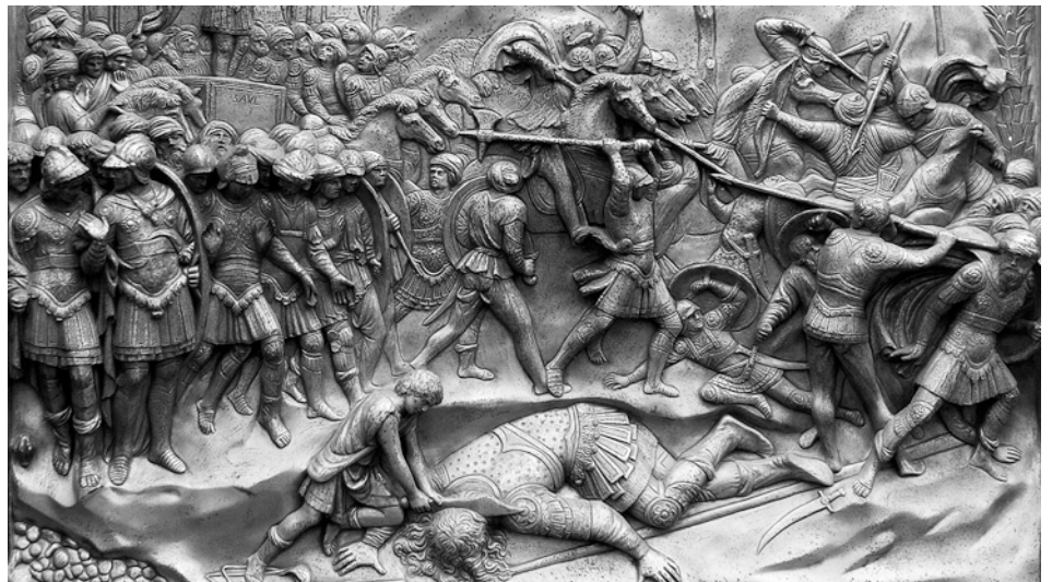
David derrota a Goliat. Talla de Lorenzo Ghiberti, iglesia de San Juan, Florencia

Hoy día, por ejemplo, existe un debate entre los historiadores, sobre si Astarté fue comúnmente adorada en Jerusalén como diosa consorte del Señor.