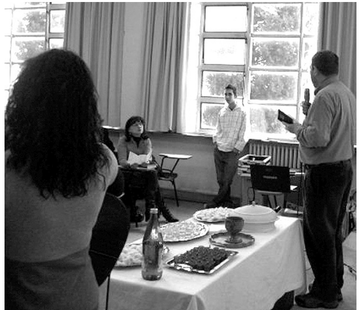
Arriba: cánticos y alabanzas.