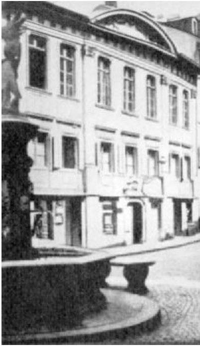
En esta calle de Zurich estaba la casa donde vivió Conrado Grebel en los años 1508-14 y 1520-25.

la vez un ciudadano patriótico, prefirió la lentitud de las transiciones políticas a la marginación anecdótica de los radicales.