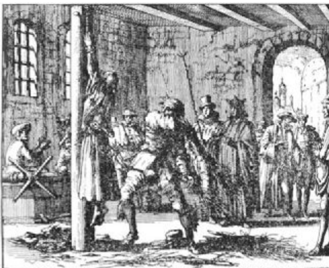
Tortura de una anabaptista. Grabado de Jan Luykens

La incomprensión y persecución a que fueron sometidos los anabaptistas en todas partes hacía natural la emigración hacia las tierras que se mostraran algo más tolerantes. Tal fue el caso de Moravia, donde fueron a parar varios miles de suizos, alemanes y especialmente austríacos. La persecución en Austria fue especialmente severa. El archiduque Fernando llegó a establecer un cuerpo especial, los Täuferjäger o «cazadores de bautizadores» con la misión de recorrer el país espionando e investigando, cazando y dando muerte a los anabaptistas como si se tratara de alimañas. Aunque el archiduque Fernando era también soberano de Moravia, la nobleza morava no hacía mucho caso de Viena. Así es como muchos nobles moravos aceptaron la presencia pacífica de inmigrantes anabaptistas en sus tierras.